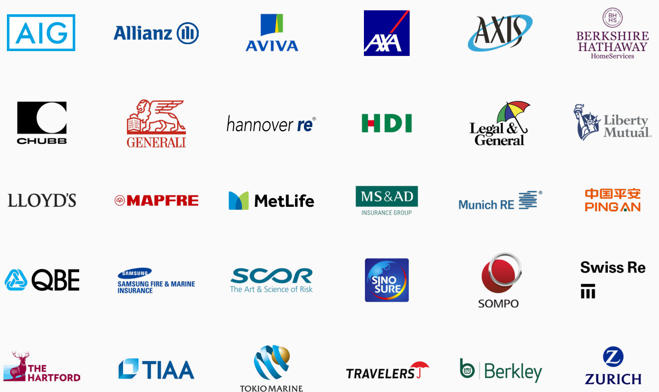
图表一:该报告所涉及的保险公司

穆迪投资者服务公司 首席煤炭分析师本杰明·尼尔森表示,煤炭撤资运动“正如一只蟒蛇慢慢挤压着整个煤炭行业。” 8