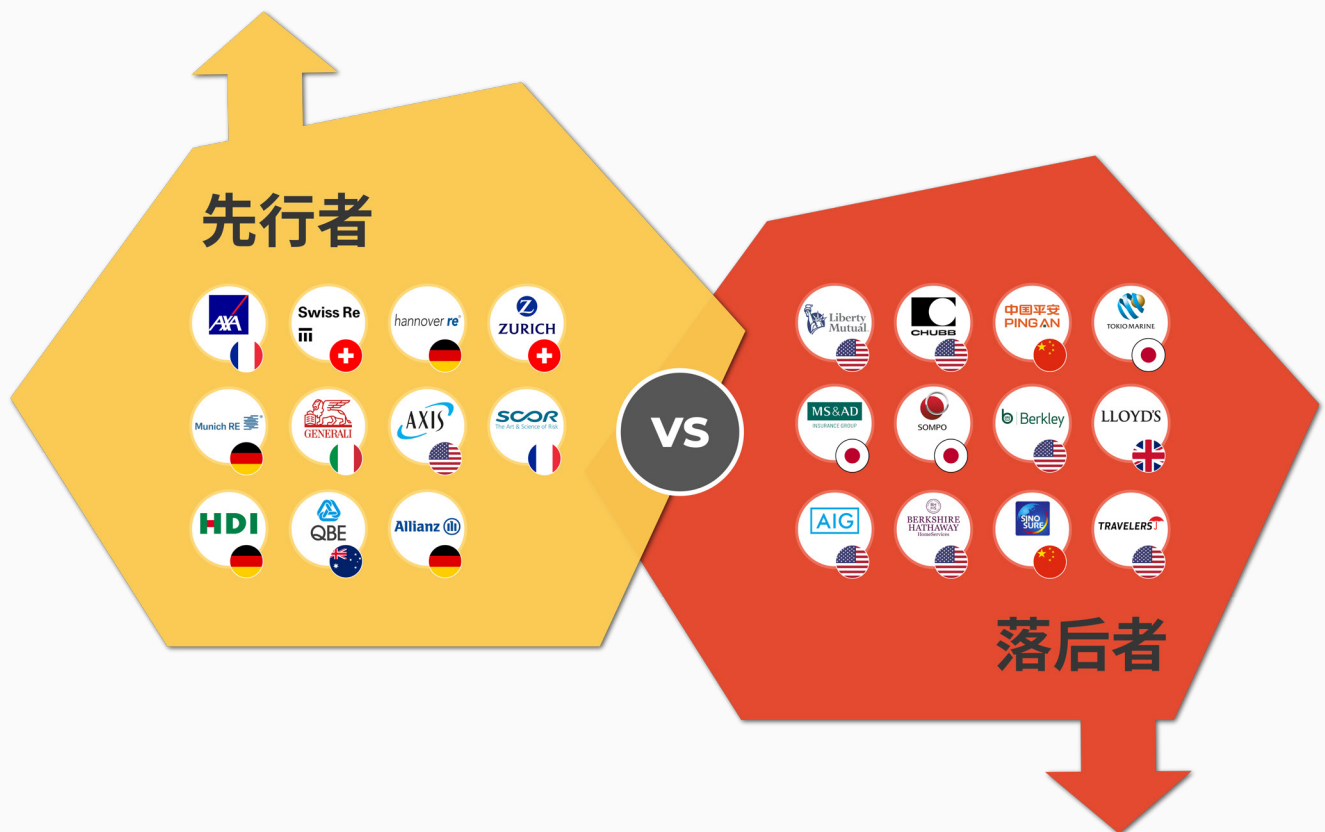
图表二:退煤领域的“先行者”和“落后者”

“ 投保我们的未来 ”分析了全球保险业在低碳经济转型中扮演的角色。根据一项包含40多个问题的问卷调查,该报告对30家知名保险公司在化石能源承保、撤资和气候领导力方面的相关政策开展了评估和评分。其中20家公司回复了问卷或提供了相应资料, 20 而对那些没有回复问卷的公司则根据其自身公开信息评分。